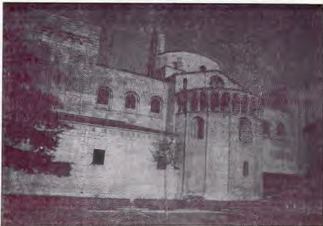
Creuer i absis central de la Catedral de la Seu d'Urgell

de canó. Des del replà de l'església la vista sobre el poble és ben bonica. Voldríem arribar fins a Sant Joan de Montanissell, però ens trobem altre cop amb una pista revessa que ens fa desistir de l'aventura. Renunciem, doncs, a visitar el lloc per dedicar més temps a Valldarques.