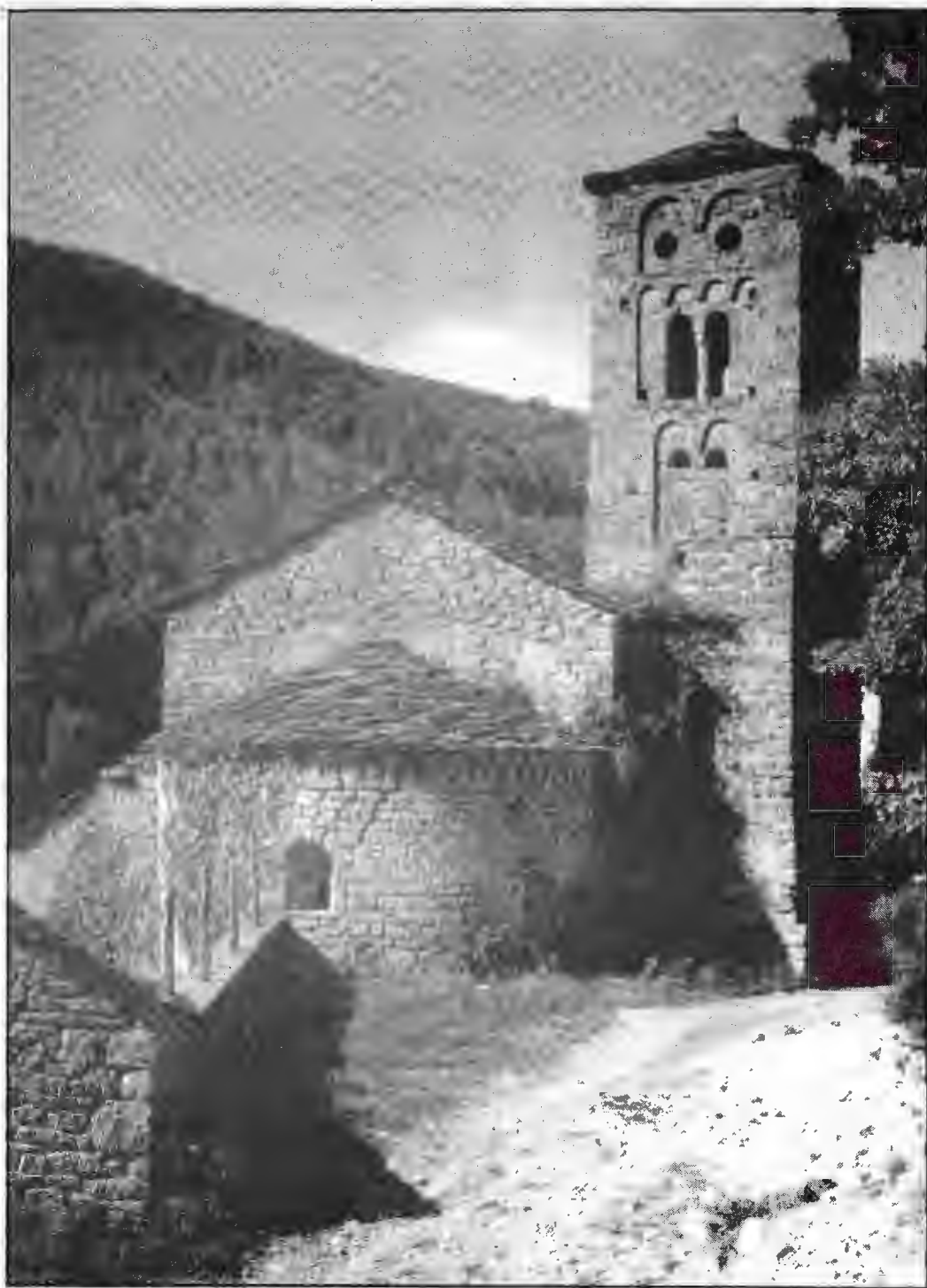
Sant Romà de Valldarques